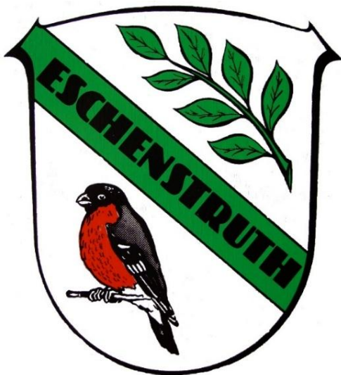
Wapen van Eschenstruth

Dank aan alle personen die aan de uitwisselingen hebben meegewerkt. Maar ook veel dank aan het voormalig gemeente bestuur van Krimpen aan de Lek en Nederlek die de uitwisselingen mede financieel mogelijk hebben gemaakt.