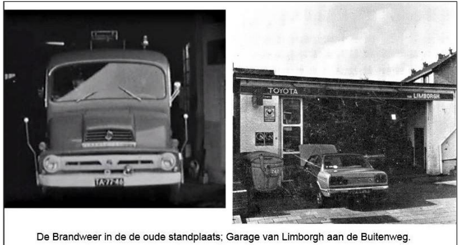
De Brandweer in de de oude standplaats; Garage van Limborgh aan de Buitenweg.

Er kwam een brandweerauto i.p.v. slangenwagens. De standplaats voor de auto was bij garage Van Limborgh aan de Buitenweg.