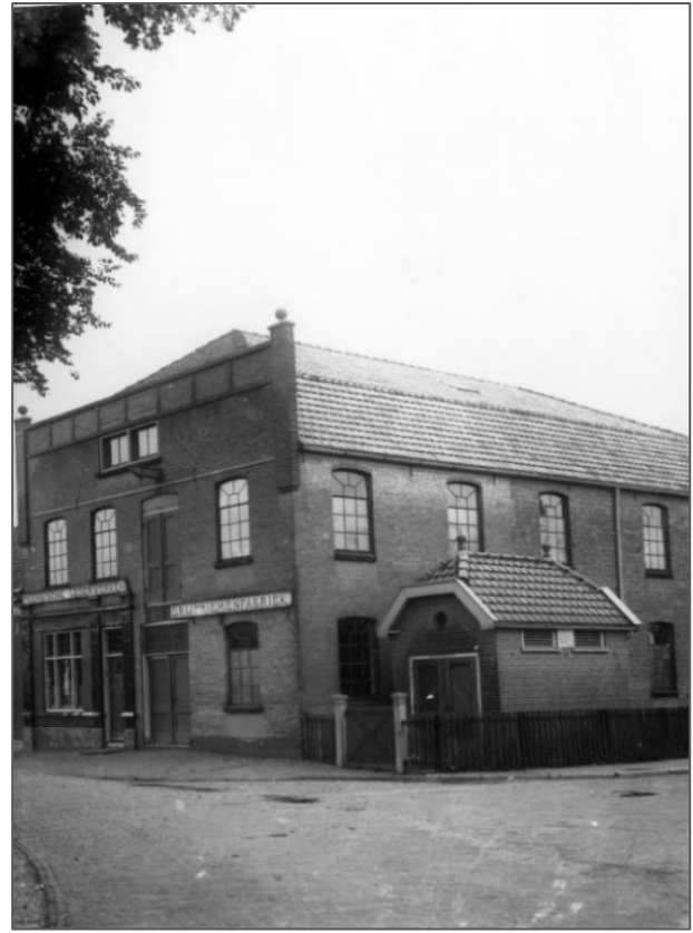
Onder de Waal 32, huisje staat rechts