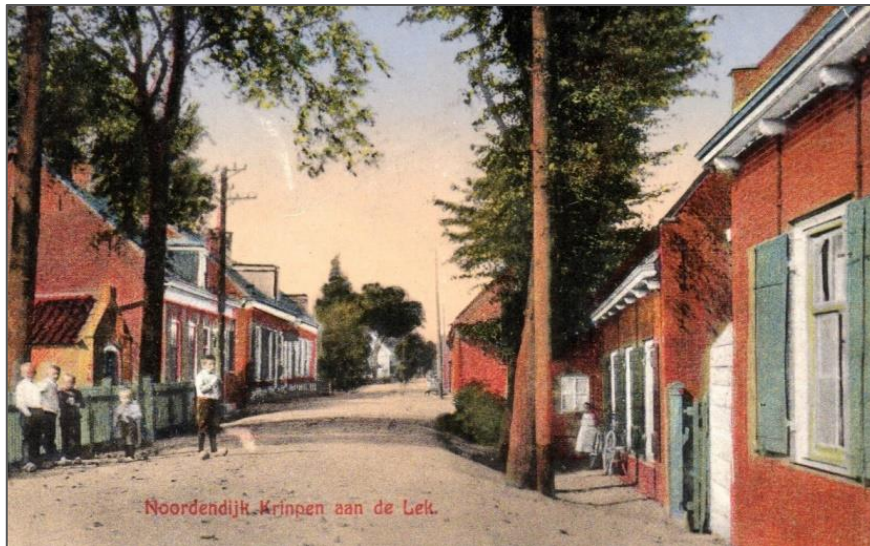
Noord 9, het huisje staat links waar de kinderen staan.

Drie brandspuithuisjes zijn gesloopt. Het enige overgeblevene staat aan het Middelland 32, naast de oude begraafplaats. Het is een gemeentelijk monument dat rond 1890 is gebouwd en heeft een zadeldak met windweerconstructie met een makelaar. De voorgevel heeft een ronde opening en aan de zijgevels zitten rechthoekige vensteropeningen met naar beneden geklapte latten voor ventilatie. De ventilatieopeningen waren nodig om na een brandblussing de slangen te laten drogen. Na vele jaren van overleg met de gemeente is dit brandspuithuisje opgeknapt. Het verrotte houtwerk aan het dak is vervangen en ook het kozijn en de deuren zijn geheel vernieuwd. De deuren zijn weer in de stijl van rond 1985 uitgevoerd. Er zaten toen ook verticale delen op de deur. Het geheel ziet er weer netjes uit.