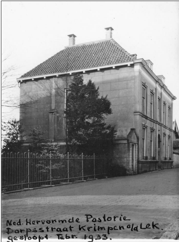
Dorpsstraat 33, gebouwd rond 1869