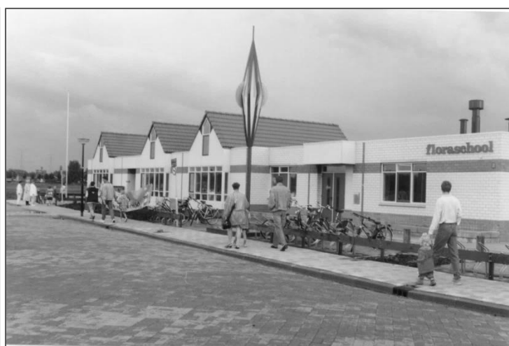
Figuur 13 Floraschool aan het Baken