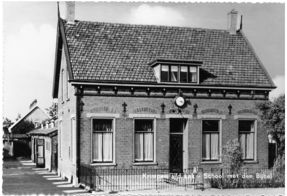
Figuur 5 School met de Bijbel en Hoofdonderwijzerswoning

Het gebouw op de foto is niet het eerste schoolgebouw van de Christelijke Schoolvereniging op Gereformeerde Grondslag voor lager onderwijs. Kort na de oprichtingsvergadering op 7 november 1904 werd al op 1 april 1905 begonnen met het geven van onderwijs in een houten loods aan de Dorpsstraat. Deze was beschikbaar gesteld door de heer A. de Jong Kzn. Men begon met 67 leerlingen en één onderwijzer. Omdat dit niet werkbaar was werd in mei van datzelfde jaar een tweede leerkracht aangetrokken. Omdat het leerlingenaantal gestaag