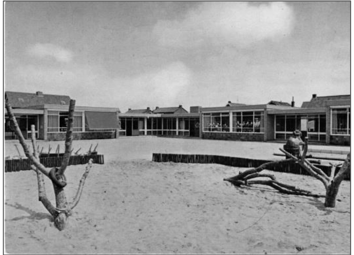
Figuur 9 Kleuterschool De Speeldoos

De Christelijke Kleuterschool heeft een nogal zwervend bestaan geleid. Na de oprichting in september 1959 werd gebruik gemaakt van het houten verenigingsgebouw van de Hervormde Gemeente aan de Tuinstraat. In de jaren daarna vond men onderdak door kleuterklasjes her en der onder te brengen in o.a. een lokaal van de basisschool, de Gereformeerde Kerk en de leegstaande Openbare Kleuterschool aan de Schoolstraat. In 1971 werd naast de lagere christelijke school aan de Admiraal de Ruyterstraat de nieuwe kleuterschool De Speeldoos gebouwd. Zoals eerder vermeld is de kleuterschool inmiddels al weer gesloopt en ondergebracht in de, in 2013 gebouwde, multifunctionele accommodatie.