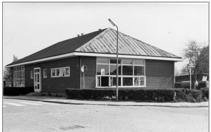
Figuur 10 Prinses Marijke Kleuterschool, Schoolstraat

Waar nu de woningen met de huisnummers Schoolstraat 28A t/m 28F staan, stond de kleuterschool die later de naam Openbare Prinses Marijke Kleuterschool kreeg (Prinses Marijke werd in 1947 geboren). Nog later kreeg de school de naam 't Hoekje. In deze school vonden vanaf 1941 t/m 1970 kleuters onderdak. In 1960 vond naast het opvijzelen van het gebouw ook een grondige renovatie plaats om weer gereed te zijn voor de toekomst. Men besteedde vooral aandacht aan een betere lichtinval door grotere ramen te plaatsen en ventilatie en verwarming werden gecombineerd in een ingenieus systeem wat er zelfs voor zorgde dat eventueel natgeregende jassen aan de kapstokken weer droog waren als de kinderen naar huis gingen. In de laatste jaren vonden niet meer alle kleuters van de Prinses Marijke