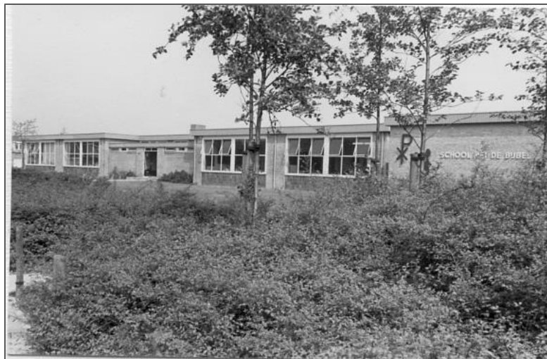
Figuur 7 De Wegwijzer