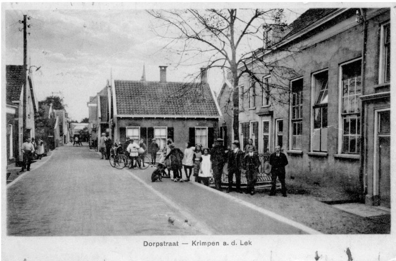
Figuur 1 School 1 aan de Dorpsstraat

Na 1925 werd het gebouw nog gebruikt voor muziekrepetities, tentoonstellingen, bazars etc. Tijdens de tweede wereldoorlog deed een gedeelte van het pand dienst als distributiekantoor en op zolder was een afdeling van de luchtbescherming gevestigd. In de voormalige onderwijzerswoning startte fotograaf Klip zijn zaak. (Later verhuisde deze naar Dorpsstraat 72) Het gebouw werd in 1953 afgebroken.