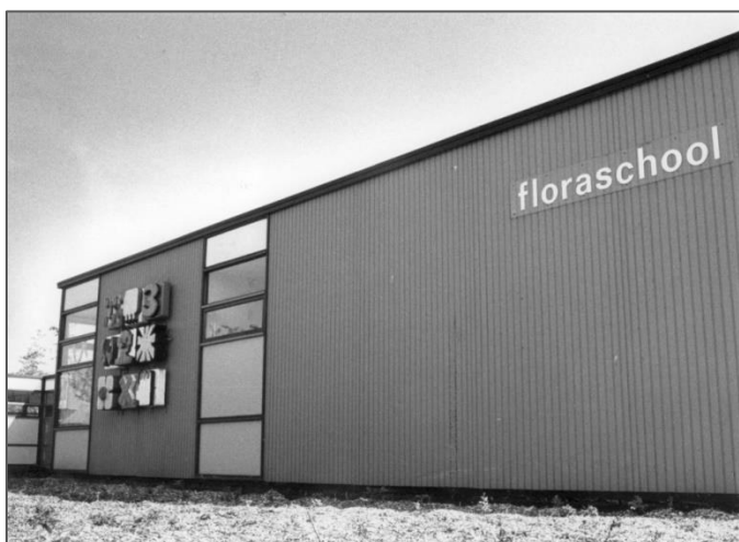
Figuur 12 Floraschool met kunstwerk van Elise van Dienst aan de Florastraat

Het gebouw aan de Florastraat werd afgebroken en op die plaats werden woningen gebouwd. Het kunstwerk dat aan de buitenmuur van de Floraschool hing bleef behouden en vond een nieuwe bestemming aan de zijgevel van Speenkruidstraat nr.1.