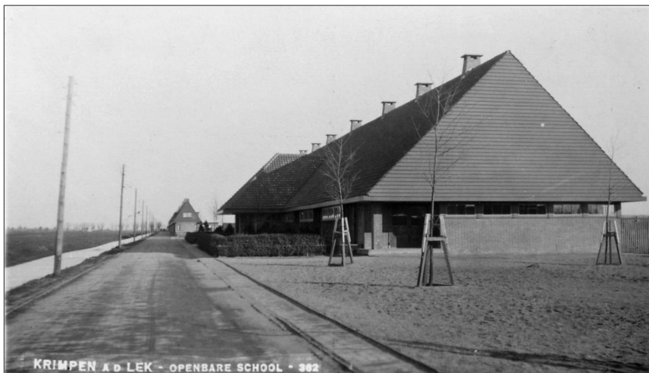
Figuur 8 Openbare Lagere School 1930

In 1925 vond de verhuizing van deze school plaats van de Dorpsstraat naar de nieuwe locatie aan de Schoolstraat. Een oud leerling zegt hierover: ' .. We kregen onze boeken en schriften in onze handen. En ook de lei, griffeldoos en sponzendoos. Zo gingen we twee aan twee van de dijk naar de Schoolstraat ... '. Zoals in het boekje van de wandelroute staat vermeld is het gebouw een ontwerp in de stijl van de Amsterdamse school van de architect P.L. Cramer (1881-1961). Cramer is vooral bekend als architect van de Haagse Bijenkorf. In het oorspronkelijk plan van de architect zouden de bouwkosten ruim Fl.100.000,- bedragen. Na herziening van de nieuwbouwplannen werd dit bedrag verlaagd naar Fl.72.800,-. In het begin heette de school gewoon Openbare Lagere School. Later kreeg de school de naam Prinses Ireneschool (Prinses Irene werd in 1943 geboren). Bijzonder is nog te vermelden dat de straat al de naam Schoolstraat had gekregen voordat de beslissing over de bouw van de school genomen was. In 2013 werd de huidige Multi Functionele Accommodatie (MFA) aan de Admiraal de Ruyterstraat gebouwd waarin tegenwoordig ook de Prinses Ireneschool is gevestigd (zie ook wandelroute nr. 25). Sinds 2017 is het oude gebouw, na herontwikkeling, geschikt gemaakt voor bewoning en zijn er 8 woningen in ondergebracht.