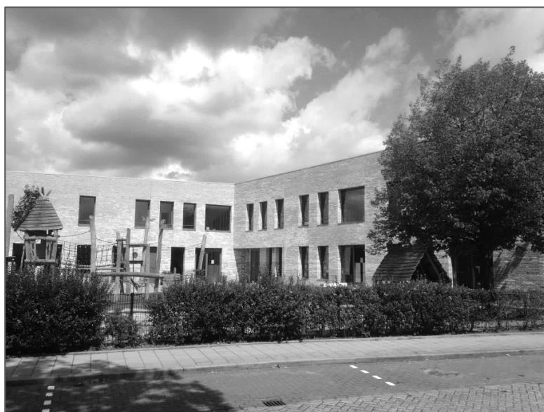
Figuur 14 Multifunctionele Accommodatie (MFA)

De Multifunctionele accommodatie (MFA) is in 2013 gebouwd, naar een ontwerp van Atelier PRO. In dit gebouw bevinden zich de Protestants Christelijke basisschool De Wegwijzer, de openbare basisschool Prinses Irene, de buitenschoolse opvang (Stichting Kinderopvang Nederlek) en een gymzaal.