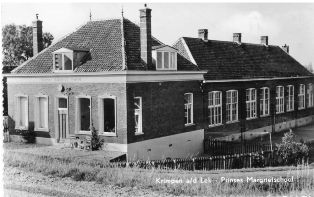
Figuur 4 Prinses Margrietschool, Molendijk

Deze school werd rond 1882 gebouwd. De naam suggereert dat dit schoolgebouw aan de Noord staat. Vroeger heette dit deel van de dijk waar namelijk de Noord. Tegenwoordig heet het Molendijk. Officieel heette deze school School nr.2. Later kreeg de school de naam Prinses Margrietschool. De school was bedoeld voor openbaar onderwijs voor kinderen van het Middelland, de Molendijk, de Noord en de Zaag, maar ook kinderen van de Krom in Krimpen aan den IJssel gingen hier naar school. Het gebouw bestaat uit een schoolgebouw met 4 klaslokalen en een woning voor de hoofdonderwijzer. In de begintijd waren gezinnen met 8 of 9 kinderen geen uitzondering waardoor de school goed bezet was. Later werden slechts