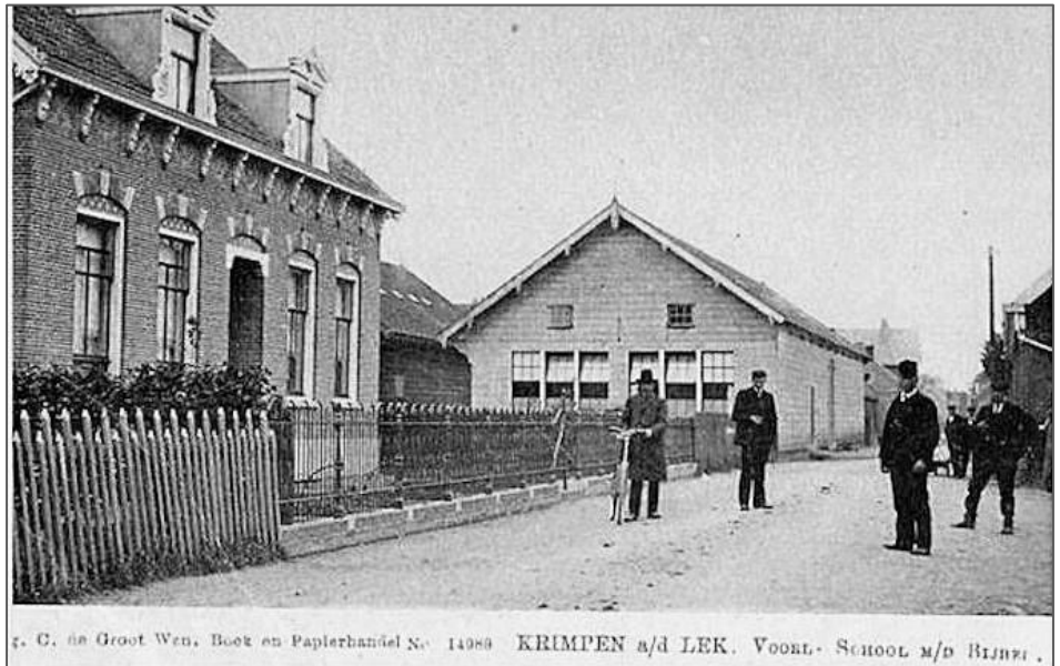
Figuur 6 Houten loods A. de Jong

financieel opzicht was het een prestatie, want hoewel de schoolstrijd al in 1878 gestreden was waren de subsidiemogelijkheden voor het bijzonder onderwijs nog niet echt ruim. In de loop der jaren werd het schoolgebouw uitgebreid. In 1912 werd een vierde klaslokaal in gebruik genomen en in 1920 werd een vijfde klaslokaal bijgebouwd. Halverwege de zestigerjaren van de vorige eeuw werd het schoolgebouw erg bouwvallig en voldeed het niet meer aan de eisen. Het was duidelijk dat er een