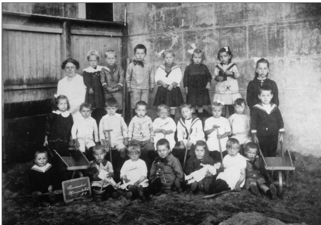
Figuur 2 Bewaarschool Dorpsstraat rond 1920

Na 1925 werd het gebouw nog gebruikt voor muziekrepetities, tentoonstellingen, bazars etc. Tijdens de tweede wereldoorlog deed een gedeelte van het pand dienst als distributiekantoor en op zolder was een afdeling van de luchtbescherming gevestigd. In de voormalige onderwijzerswoning startte fotograaf Klip zijn zaak. (Later verhuisde deze naar Dorpsstraat 72) Het gebouw werd in 1953 afgebroken.