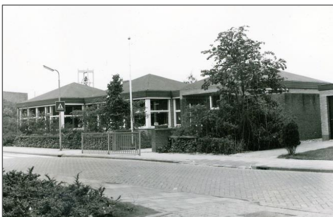
Figuur 11 Prinses Marijke Kleuterschool, Jacob Catsstraat

Kleuterschool onderdak in dit gebouw. Vanwege ruimtegebrek werd ook gebruik gemaakt van het ESVEKA-gebouw en het clubgebouw van postduivenvereniging De Reisduif. In 1970 verhuisde de Kleuterschool naar een nieuw onderkomen aan de Jacob Catsstraat. Het lege gebouw aan de Schoolstraat werd nog enige tijd gebruikt door de Christelijke kleuterschool tot ook zij een nieuw gebouw konden betrekken aan de Admiraal de Ruyterstraat. In 1988 werd de kleuterschool samengevoegd met de Prinses Irene