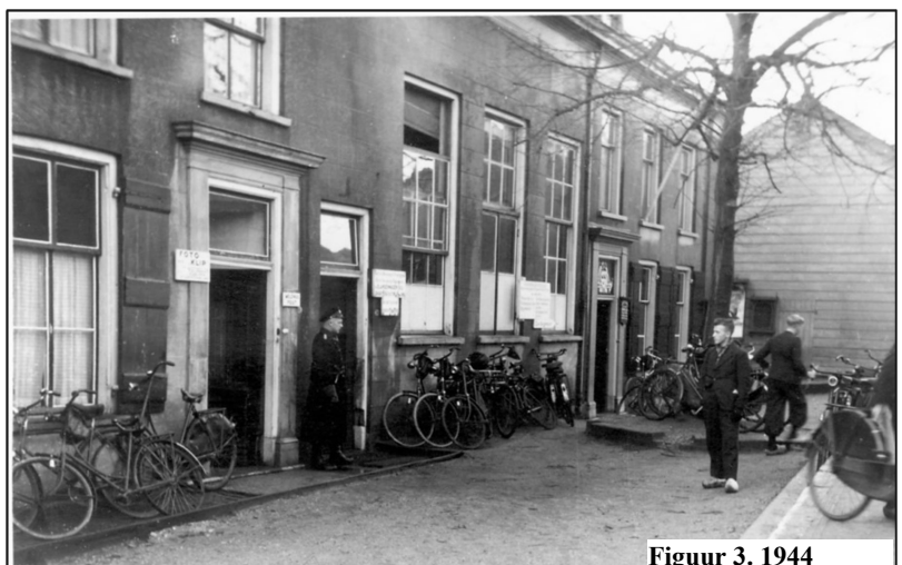
Figuur 3. 1944

Op 30 december 1947 werd in een besloten vergadering van de gemeente Krimpen aan de Lek gesproken over de aankoop van het perceel Dorpsstraat 7. Op zaterdagmiddag ging de voltallige raad het pand bekijken. Dit pand is gebouwd in het jaar 1905 en in eigendom bij de familie Boogaardt. Op 30 januari