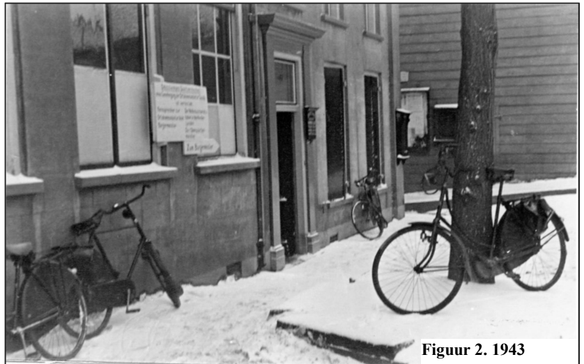
Figuur 2. 1943

Op 9 maart 1940 komt de gewenste goedkeuring van Gedeputeerde Staten. De kosten zijn in tussentijd wel opgelopen tot bijna f40.000,-.