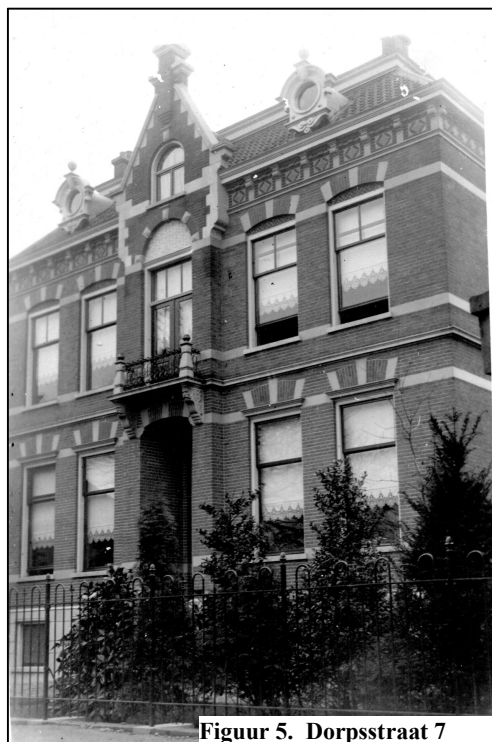
Figuur 5. Dorpsstraat 7

Het raadsbesluit tot ruiling werd op 8 maart 1949 door Gedeputeerde Staten van Zuid-Holland goedgekeurd. Het pand Dorpsstraat 7 was gedeeltelijk in eigen gebruik en was verhuurd voor een termijn van een jaar.