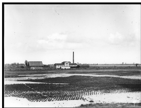
Stoommolen, gezien ongeveer vanaf de oude drijfriemenfabriek

Het jaar 1910 moet voor Marinus Visser bijzonder zijn geweest. De watertoren werd in gebruik genomen, de molen brandde af, zijn oude huis werd afgebroken en hij betrok een nieuw huis met, voor het eerst, een drinkwateraansluiting