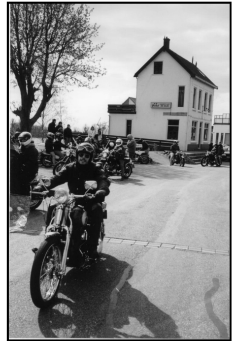
"BAR GEZELLIG" als stopplaats voor fietsers en motorrijders

Ook dit pand gaat nu verdwijnen, nadat het meer dan 100