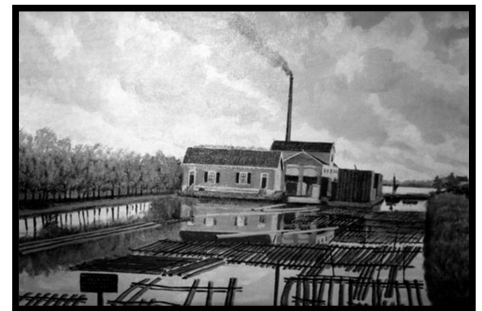
Oude stoommolen van houthandel fa. Boogaerdt

plaatsvonden. Men was wel hoog water gewend in dit huis maar nu ging het goed mis, het water steeg tot het plafond in het onderhuis. Natuurlijk had men alle belangrijke