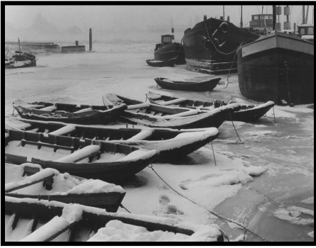
Te verhuren roeiboten achter het café