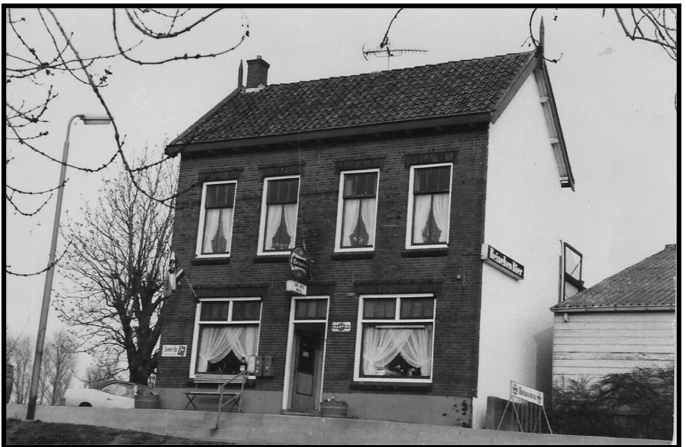
Café "BAR GEZELLIG"

Waar nu op de gevel "BAR GEZELLIG" prijkt, stonden vroeger 2 huisjes.