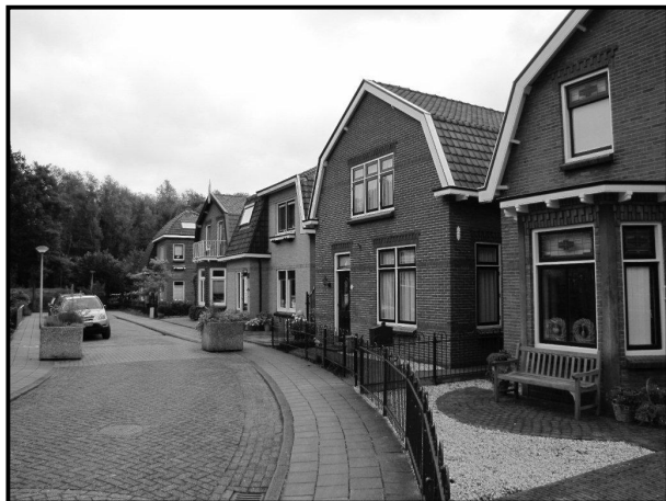
Huizen in de Buitenweg

Waarschijnlijk is zijn herkenbare bloembak/goot een architectengrapje. Een stukje goot op de verdieping onder de raamdorpelstenen, die tevens kan worden gebruikt als plantenbak..