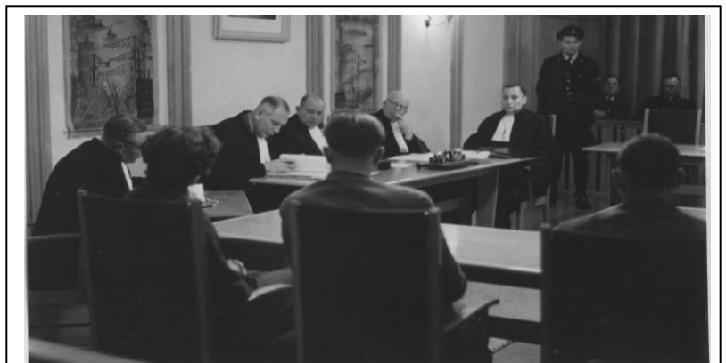
Een vraag aan de lezers: Een rechtzitting in het gemeentehuis in 1956. Ter gelegenheid van wat?