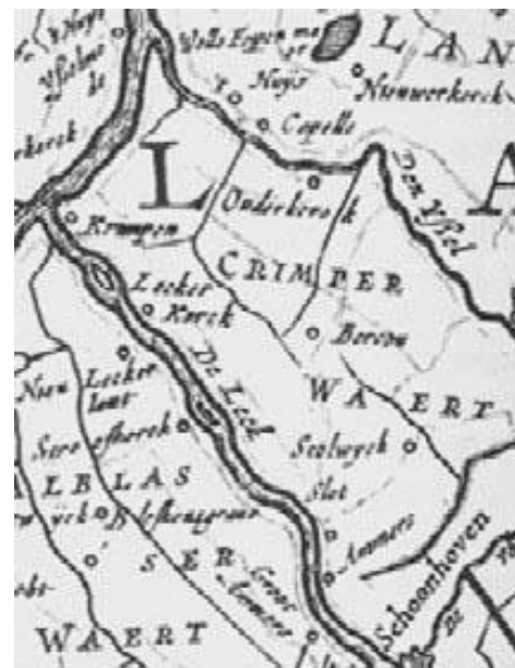
Een heel oude plattegrond van de 'Crimperwaard'

Ongeveer een eeuw nadat Hendrick Symonsz Diepraam van Santen uit het Rijnland van zijn voorvaders